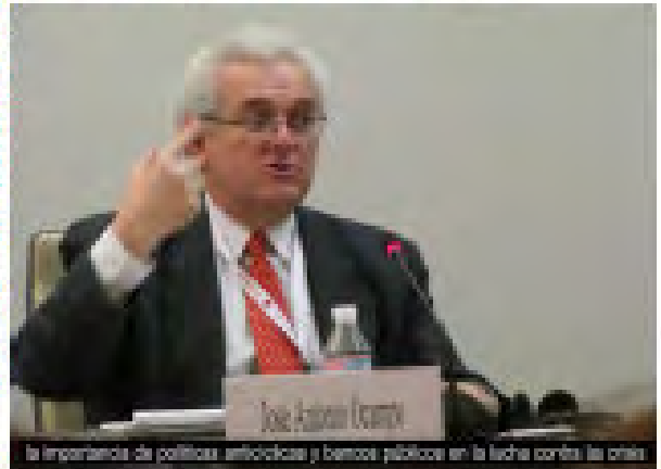
La importancia de políticas anticíclicas y bancos públicos en la lucha contra la crisis

Las Instituciones Financieras Internacionales (IFI) deben poner fin a su equívoca condicionalidad de las políticas de ajuste estructural y proporcionar a los países en desarrollo el espacio político para llevar a cabo unos programas de estímulo eficaces, además de introducir medidas anticíclicas dirigidas a mitigar los impactos de la crisis. No debe permitirse que la OMC y las políticas comerciales bilaterales socaven las bases productivas de las economías nacionales y locales. Es preciso que se apliquen los principios del comercio justo, incluido el del menos que plena reciprocidad y el espacio político adecuado para que los países en desarrollo determinen el ritmo de la liberalización de las importaciones y las reducciones arancelarias.