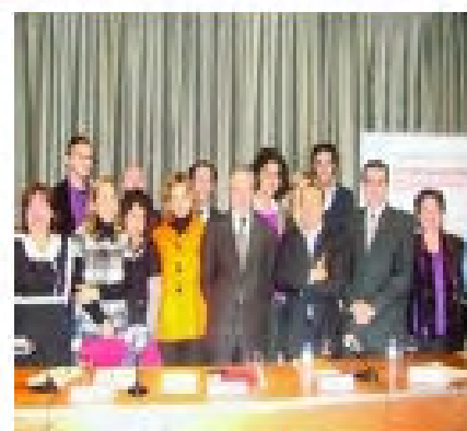
Firmantes del Pacto

Cumplid el Pacto de Estado que firmasteis. Por solidaridad, por humanidad, por decencia.