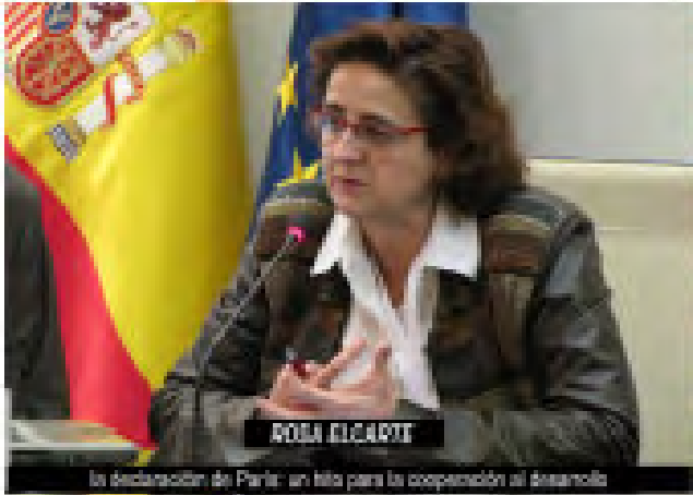
la declaración de París: un hito para la cooperación al desarrollo

crisis, la AOD para los países en desarrollo sigue siendo deficiente en cuanto a compromisos internacionales y se anticipa que las corrientes de ayuda neta disminuyan en términos absolutos en 2009-2010 debido a las limitaciones fiscales de importantes donantes. Según la Comisión Europea, en 2009 los flujos de ayuda disminuyeron EUR 22.000 millones 2 .