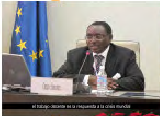
El trabajo decente es la respuesta a la crisis mundial

Las últimas tendencias mundiales de empleo de la OIT anticipan que los elevados índices de desempleo van a permanecer invariables a pesar del incremento en el crecimiento económico mundial; y en los países emergentes y en desarrollo las