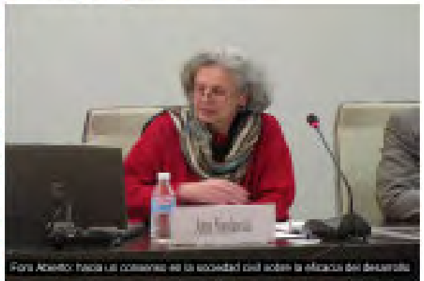
Foro Abierto para la eficacia de la sociedad civil sobre la eficacia del desarrollo

Los sindicatos se han comprometido a implicarse activamente con el Foro Abierto para la Eficacia del Desarrollo de las OSC, con su triple objetivo de construir un marco apropiado para la eficacia del desarrollo de las OSC; promover un entorno de aprendizaje sobre la eficacia del desarrollo de las OSC; y participar en un diálogo de múltiples partes interesadas con gobiernos y donantes a fin de desarrollar entendimiento y apoyo para la creación de un entorno favorable para las OSC. Desde el punto de vista sindical esto debe incluir un entorno favorable al ejercicio de los derechos sindicales fundamentales.