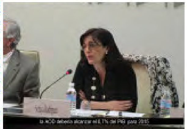
La AOD debería alcanzar el 1% del PIB para 2010

Los países en desarrollo deberían esforzarse por reducir su dependencia en la financiación exterior, dadas las tremendas deficiencias en la financiación de las necesidades de desarrollo, incluidos los ODM, pero muchos van a necesitar la Ayuda Oficial al Desarrollo (AOD) durante bastante tiempo, y los países desarrollados deben mantener sus compromisos. Por desgracia, como consecuencia de la