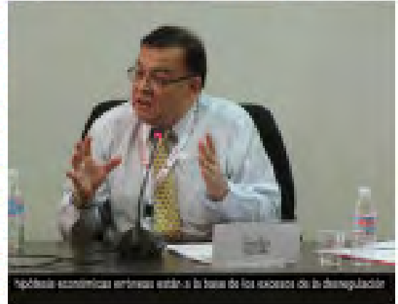
Políticas económicas erróneas están a la base de los sucesos de la desregulación

Los participantes sindicales pusieron de relieve las luchas en las que llevan décadas implicados para intentar modificar las políticas económicas neoliberales situadas en el origen de la crisis. Junto con una gobernanza mundial inadecuada, estas políticas habían conducido a desequilibrios económicos fundamentales, y la crisis alcanzó un punto crítico a raíz de la imprudente especulación financiera. El vasto crecimiento de la desigualdad a lo largo de las dos últimas décadas no sólo ha sido socialmente injusto sino que se encontraba en el centro de los desajustes macroeconómicos que provocaron la crisis. La innovación financiera y los mercados financieros desregulados no generaron economías más eficaces – sencillamente acrecentaron los riesgos. Ahora está claro que las actividades de algunos operativos financieros vienen a tener carácter criminal, y los implicados han de ser llevados ante la justicia.