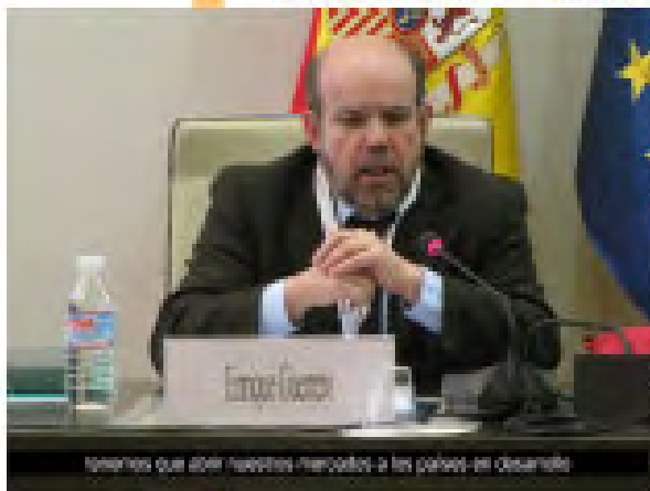
temas que aún quedan relativos a la crisis en Océano

Se necesitan medidas coordinadas a nivel global para abordar lo que sigue siendo una crisis mundial y se necesitan por tanto reformas sistémicas profundas para conseguir que los países en desarrollo puedan encontrar la manera de salir de la crisis, y una vía para el crecimiento sostenible. En este avance, sería prematuro salirse de los paquetes de estímulo, como lo están sugiriendo aquellos con intereses personales en el statu quo. La aplicación de los paquetes de estímulo debe mantenerse durante un tiempo, con un énfasis en las inversiones productivas, los empleos verdes y el trabajo decente. Esto es imprescindible a la hora de poner en marcha un proceso de crecimiento redistributivo justo en la economía global. Pero debe, no obstante, estar vinculado a reformas sistémicas a más largo plazo en