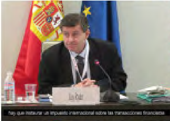
Rajoy que restablece el impuesto internacional sobre las transacciones financieras

sobre los bancos y demás instituciones financieras. También se pueden sacar lecciones a partir de una revisión de los países que han sido más o menos vulnerables a los shocks externos engendrados por la crisis. Es preciso que los países eliminen su excesiva dependencia en los recursos de financiación externos y se centren en la movilización de recursos y ahorros domésticos. Una sólida administración tributaria y regímenes fiscales progresivos proporcionan formas de incrementar los ingresos domésticos, y los bancos públicos capitalizados a nivel nacional pueden ser instrumentos efectivos a la hora de invertir en el desarrollo, los bienes públicos y el trabajo decente. Detener e invertir el movimiento de las salidas de capital neto de los países en desarrollo es una cuestión clave para el programa de desarrollo mundial, sobre todo a