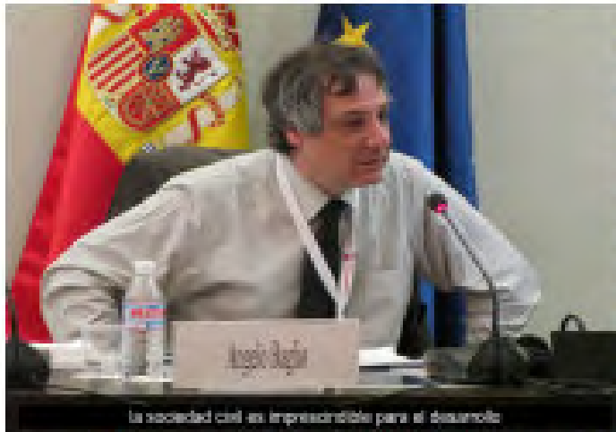
la sociedad civil es imprescindible para el desarrollo

Los sindicatos han iniciado su propio proceso de definición de principios sobre la eficacia de la ayuda, y este trabajo se irá puliendo a través de una serie de consultas. En este sentido se puso de relieve el papel de las organizaciones regionales de la CSI (CSA, CSI-África, CSI-Asia y Pacífico, CRPE) así como la participación de las FSI.