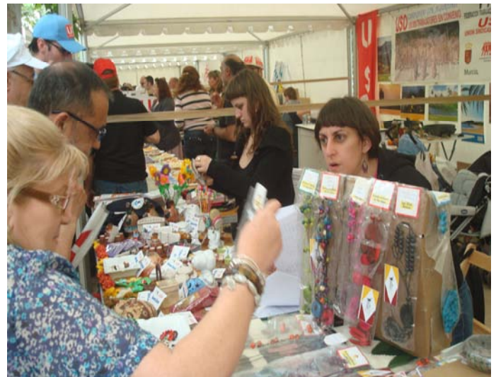
TSA del 1º de Mayo en Madrid