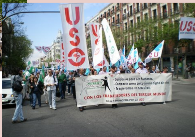
SOTERMUN en la Manifestación de Madrid

En este número reseñamos la celebración del 1º de Mayo que SOTERMUN lo concentró en Valencia, aunque no sólo, en el marco de la celebración de la USO-Comunidad Valenciana y con un esfuerzo especial de solidaridad con Haití.