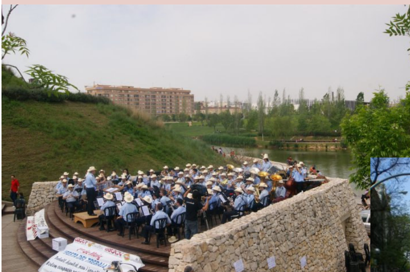
Valencia: Concierto Solidario de la Unió Musical de Torrent

Esa concepción, esa práctica, ese programa de la Solidaridad, son imprescindibles para superar la crisis en nuestro país, reconstruir otra Unión Europea más social y humana y hacer posible otro mundo habitable y sostenible.