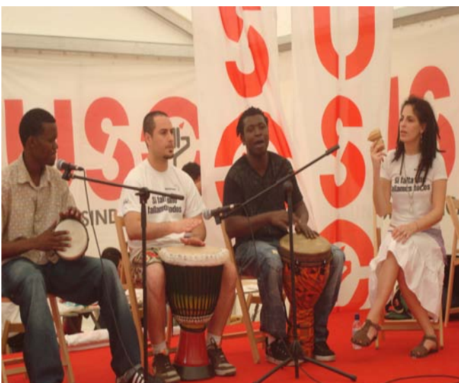
Actuación del grupo “Madera de Cayuco”