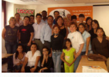
III Jornada de Formación: Peruanos como agentes de Codesarrollo y Comercio Justo en Valencia, Septiembre 2009. Sus objetivos incluyen también condicionar a los consumidores para que se comprometan y favorezcan el desarrollo sostenible así como la expresión de las culturas y valores locales. Esta iniciativa continúa con el "Fortalecimiento de organizaciones de artesanos/as del distrito de San Juan de Lurigancho y promoción del comercio justo en la comunidad Valenciana", etapa II del proyecto subvencionado hasta 2010 por la Generalitat Valenciana.