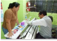
Con la cooperación de:

Uno de nuestros objetivos es la creación y puesta en funcionamiento de una Asociación Empresarial Central de productores artesanos/as TARPUPU, formada por más de 80 socios quienes organizan talleres de producción, gestión empresarial, economía solidaria y sensibilización, exhibiendo sus productos en ferias artesanales de Lima, generando ingresos para cubrir los insumos de sus propias creaciones. Una de nuestras prioridades es la creación y puesta en funcionamiento de una Asociación Empresarial Central de productores artesanos/as TARPUPU, formada por más de 80 socios quienes organizan talleres de producción, gestión empresarial, economía solidaria y sensibilización, exhibiendo sus productos en ferias artesanales de Lima, generando ingresos para cubrir los insumos de sus propias creaciones.