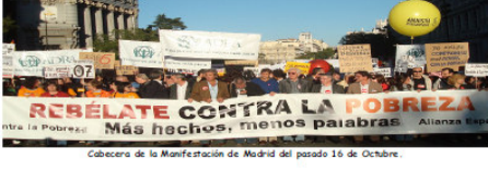
Cabeza de la Manifestación de Madrid del pasado 16 de Octubre.

(sigue y concluye en la siguiente página)