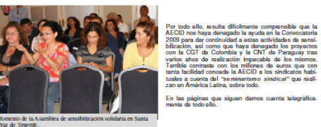
Momento de la Asamblea de sensibilización solidaria en Santa Cruz de Tenerife.

Pero todo valió la alegría y el esfuerzo pues llevamos a más de 800 compañeros y compañeras de la USO y SOTERMUN, así como a otros sectores de la ciudadanía a través de los medios informativos, la realidad de nuestro trabajo solidario en esos países de América Latina y África, en este caso, la política española de cooperación internacional realizada con el esfuerzo fiscal de todos a través de la AECID, la instancia machacona en el cumplimiento de los Objetivos del Milenio, la necesidad de que estas costosas actividades de sensibilización se materialicen en nuevas afiliaciones a SOTERMUN-USO.