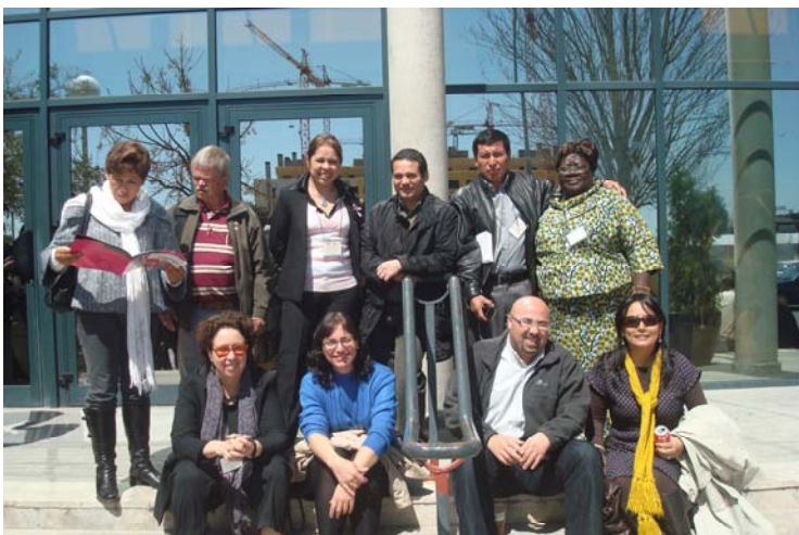
Contrapartes fraternales participantes en el Seminario “La realidad de la economía informal en los países del Sur en tiempos de crisis”

Se trata del hermanamiento suscrito, y en fase de aplicación ya avanzada, entre USO-SOTERMUN de Baleares y FENTRALUC-CAJAPATRAC (lustradores de calzado) del Perú. Iniciada la experiencia, tal como prevé nuestra Campaña Permanente de Solidaridad Sindical Internacional (CPSSI) ésta debe extenderse a otras organizaciones de USO-SOTERMUN