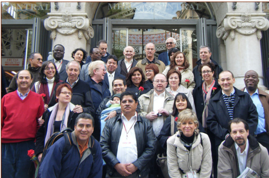
Compañeros y compañeras de las organizaciones fraternales con el Equipo de SOTERMUN

“Por una globalización humana y solidaria: un diagnóstico y una alternativa común”