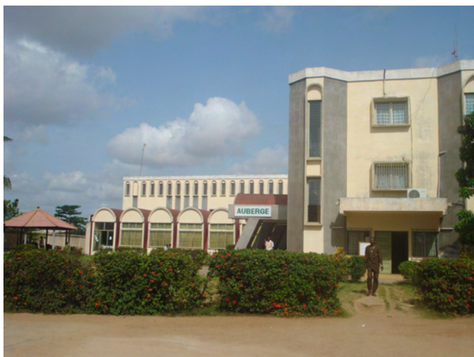
Fachada de la sede de la CSI-Africa en Lomé-Togo

Los compañeros africanos fijaron sus prioridades y necesidades ante las organizaciones fraternales europeas y norteamericanas que pasan por: potenciar las estructuras organizativas y administrativas de la CSI-Africa y de las organizaciones filiales, potenciar la formación y capacitación sindical y social de los sindicatos para el fomento de una acción sindical que promueva el trabajo digno, la gestión y ejecución de proyectos de cooperación, la defensa y promoción de los distintos sectores de la economía informal urbana y agraria, etc.