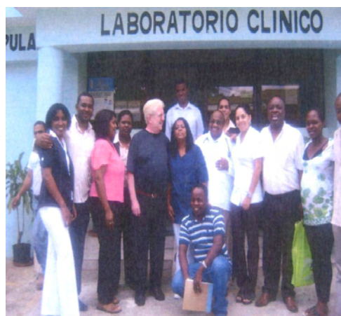
Presidente de Sotermun con el Equipo Directivo de MOSCHTA

Por último, Zaguirre visitó la sede de MOSCHTA, se reunió con sus dirigentes y viajó a un batey (poblados misérrimos donde viven en estado de absoluto abandono los inmigrantes haitianos y sus familias que trabajan las plantaciones de caña), donde se