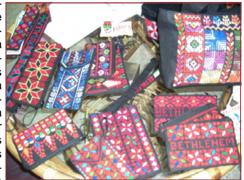
Trabajos realizados por las mujeres de Belén.

Hay que destacar la visita que hicimos a Belén en donde se impartía una charla a mujeres artesanas con el propósito de que mejorasen y revalorizasen su trabajo, actualmente dependiente de mayoristas, para que se atrevieran a vender directamente a los turistas y cuidasen aspectos relevantes como la envoltura de regalo. Allí tuvimos la oportunidad de ver muestras de los trabajos de esas mujeres, artesanas de diferentes técnicas, bordados, vestidos, madera, vidrio, bolsas, monederos, cubremóviles, llaveros, tapices, etc.