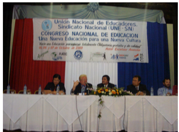
En el Congreso de los educadores paraguayos