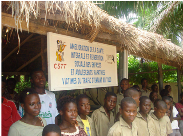
Niños y niñas beneficiarios de un proyecto solidario de SOTERMUN con la CSTT de Togo.

En su discurso ante el Congreso de la CSTT, Zaguirre afirmó la voluntad de USO-SOTERMUN de intensificar nuestro trabajo solidario en Africa, el continente donde nació la especie humana y al mismo tiempo el más rico y empobrecido. Resaltó, asimismo, el gran reconocimiento que supone para la CSTT que la CSI-Africa haya decidido instalar su Sede africana y el Centro de Formación Sindical en Lomé, la capital de Togo, en el mismo edificio que acogió durante 30 años a la organización africana de la exCMT y a su Universidad Sindical que tras la unidad sindical, servirá ahora a todos los trabajadores y trabajadoras de Africa.