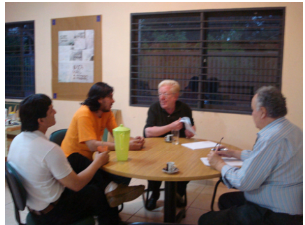
Con el equipo directivo de SEPA (Servicio Ecueménico de Promoción Alternativa)

En diversas comparecencias ante los medios informativos Zaguirre reiteró el apoyo al proceso de cambio histórico que debe impulsar el presidente Lugo, "pero para ayudarlo es imprescindible que se ayude él, que pacte con las organizaciones sindicales, sociales y populares el calendario y los plazos de la reforma inaplazables, que se enfrente el problema de la evasión fiscal absoluta de las grandes fortunas y empresas paraguayas y que continúe el esfuerzo para que Brasil y Argentina paguen a Paraguay el justiprecio por la energía eléctrica que este país les suministra..."