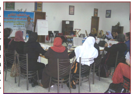
Cursillo "Empoderamiento de los y las trabajadoras en la economía informal en Belén"

tienen permiso de trabajo en zona israelí, (o que los israelíes consideran como parte de su territorio, por ejemplo al Oeste del Muro, aunque se esté dentro de Cisjordania ocupada). No les habían subido el sueldo desde hacía tiempo, pero, según su capataz (israelí) eran buenos trabajadores y, por eso, no les despedían y no cogían como nuevos trabajadores recientes inmigrantes judíos-israelíes, rusos. Uno de ellos había tenido un accidente laboral en un dedo. En su día, la empresa no le llevó a un hospital y cuando fue asistido, la clínica le exigió el pago de su curación. WAC había pagado dicha factura y después había negociado y logrado que la empresa pagase la factura y la promesa de atender hospitalariamente al trabajador si se producía un nuevo accidente. WAC había conseguido afiliar a todos los trabajadores y creado una 'unión'. El intermediario, para dar una solidez a las relaciones. Con WAC tenemos diversos proyectos de cooperación, todos ligados a trabajadores árabes israelíes, que no tienen estímulos para sindicalizarse en Histadrut, el sindicato único israelí sumiso siempre a los gobiernos.