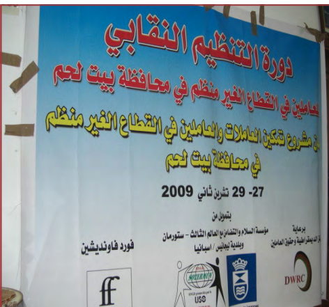
Cartel del cursillo "Empoderamiento de los y las trabajadoras en la economía informal de Belén"