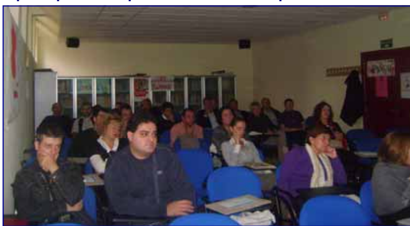
Participantes en la Jornada.

presupuestaria pese a la dura crisis que atravesamos.