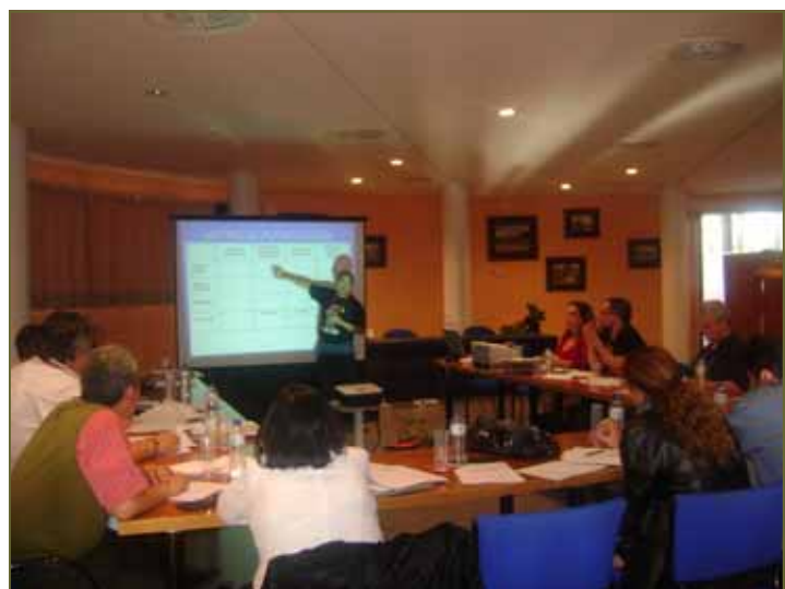
Cursillo de formación en gestión de proyectos solidarios con las contrapartes fraternales que participaron en la Jornada.