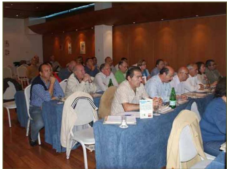
Participantes en la Jornada