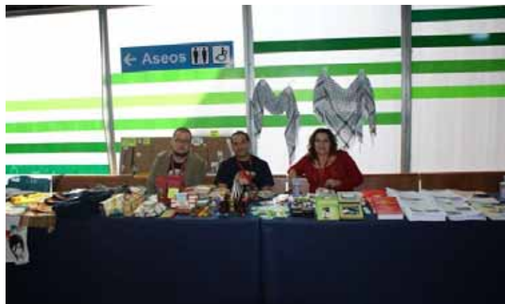
La Tienda Solidaria Ambulante (TSA)