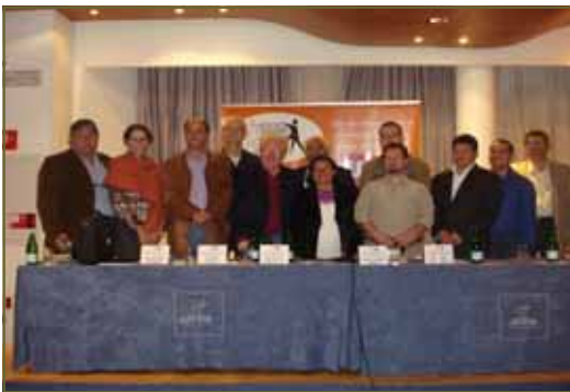
Representantes de organizaciones fraternales con responsable de SOTERMUN-USO