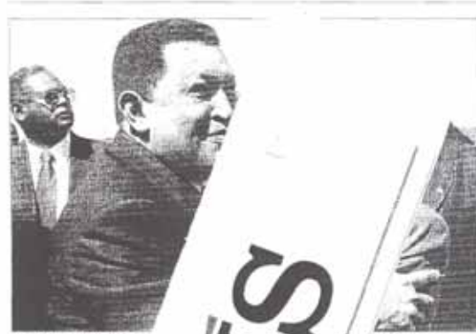
Hugo Chávez, a la izquierda, y Raúl Castro.