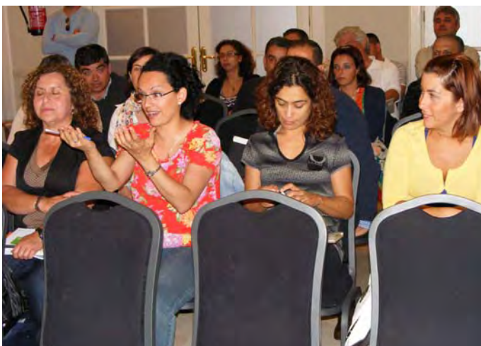
Momento de la Asamblea de sensibilización solidaria en Santa Cruz de Tenerife.

Por todo ello, resulta difícilmente comprensible que la AECID nos haya denegado la ayuda en la Convocatoria 2009 para dar continuidad a estas actividades de sensibilización, así como que haya denegado los proyectos con la CGT de Colombia y la CNT de Paraguay tras varios años de realización impecable de los mismos. Terrible contraste con los millones de euros que con tanta facilidad concede la AECID a los sindicatos habituales a cuenta del "seminarismo sindical" que realizan en América Latina, sobre todo.