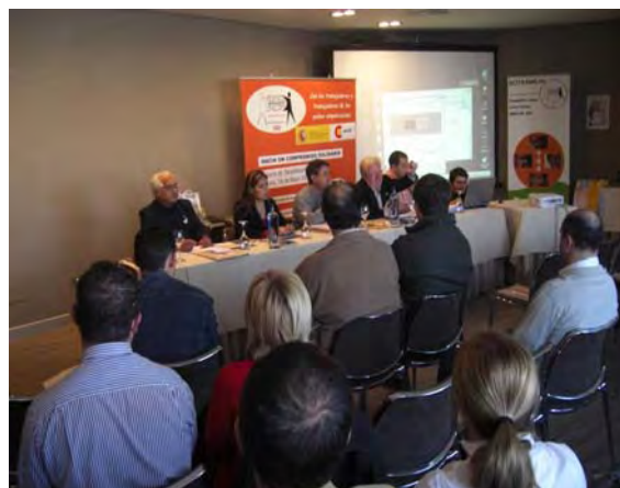
Asamblea de sensibilización en A Coruña

el Mundial 2010, cuyo plazo de inscripción acaba en dos semanas, si el organismo internacional no anula su pro- aspira a estar entre los diez primeros en la calificación y a terminar la carrera en los puntos».