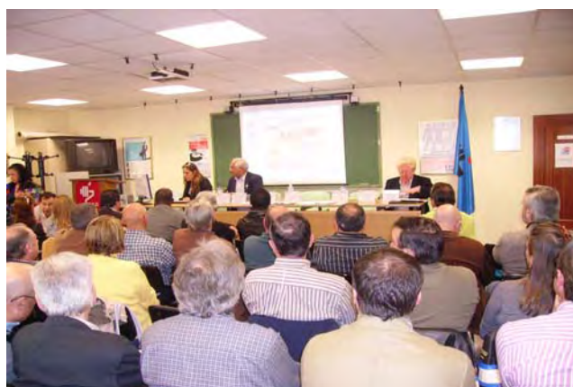
Panorámica de la Asamblea en el Centro de Formación Profesional

Haz tus aportaciones solidarias a SOTERMUN a: