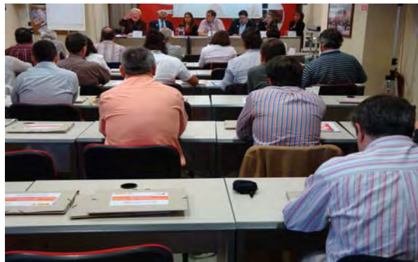
Asamblea con Federaciones Profesionales

rias de los países enriquecidos, principales responsables de la crisis, en perjuicio de los más empobrecidos que pagarían así varias veces las peores consecuencias de esta crisis.