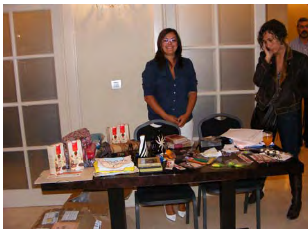
Tienda Solidaria Ambulante en la Asamblea