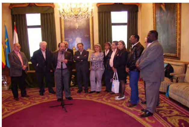
Recepción en el Ayuntamiento de Gijón