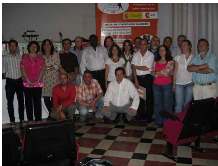
Málaga. Foto para el recuerdo de la Asamblea solidaria.