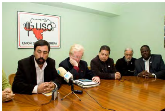
Rueda de Prensa en Santander