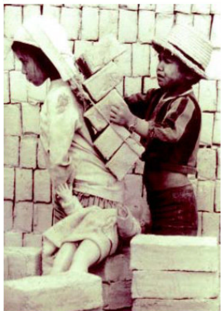
Proyecto de Erradicación del Trabajo Infantil en Colombia (1998)

Con la finalidad de cooperación al desarrollo y el fomento de la solidaridad entre los pueblos nació —en el mes de Agosto de 1994— nuestra Organización No Gubernamental, Solidaridad con el Tercer Mundo (SOTERMUN) promovida por nuestro Sindicato, la Unión Sindical Obrera (U.S.O.).