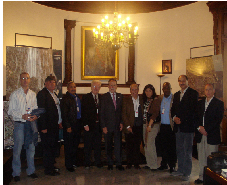
Recepción en el Ayuntamiento de Valencia.