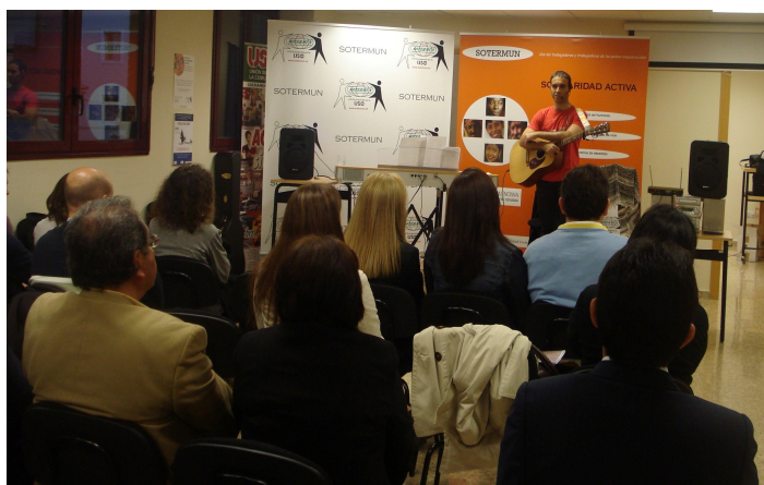
Asamblea y Velada Solidaria en Valencia