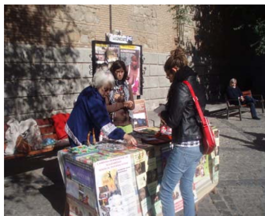
Conchita en el Mercadillo Solidario.