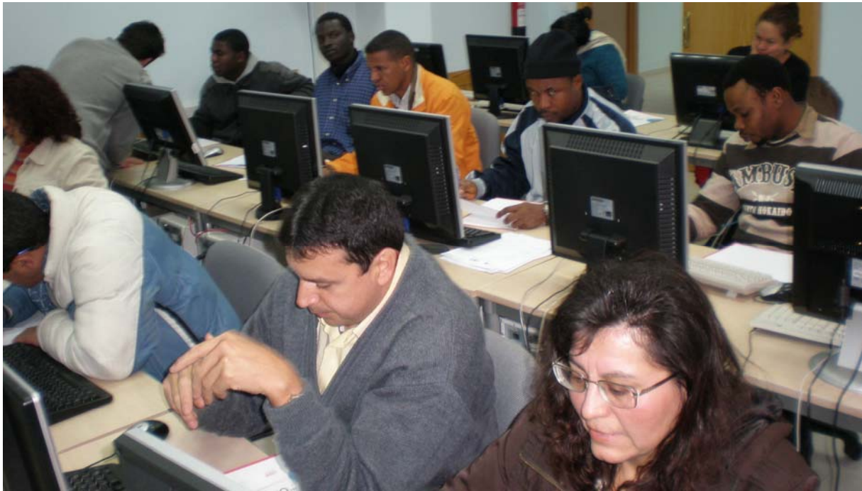
Participantes del curso de informática