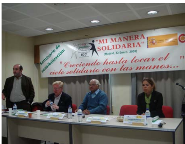
Seminario en Madrid con la CNT-UNE de Paraguay