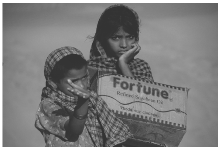
Fotografía ganadora: "Niños trabajando en el Desierto del Thar" Alessandra Moscadelli- Italia

Las fotografías son una muestra dolorosa de la discriminación, la desigualdad, el trabajo forzoso, el trabajo infantil, la falta de libertad de expresión, la economía informal, el cambio climático, la falta de salud, seguridad y protección social, la pobreza y desnutrición... que padecen las poblaciones de los países empobrecidos.