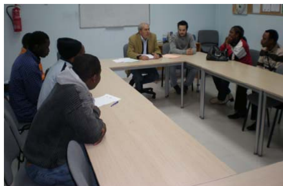
Reunión informativa sobre los derechos socio-laborales de los inmigrantes.

Asimismo, se realizó una jornada para reforzar el conocimiento de los derechos socio-laborales y sindicales de los inmigrantes, así como de las actividades solidarias que desarrolla SOTERMUN-USO en y con sus países de origen.