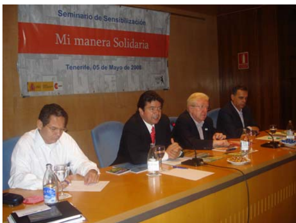
Seminario en Canarias con la CGT de Colombia

Por último, resaltar que las delegaciones frateras se reunieron con el Director de la AECID, así como con representantes de los gobiernos regionales y algunos ayuntamientos de las Comunidades Autónomas en las que se desarrolló el programa.