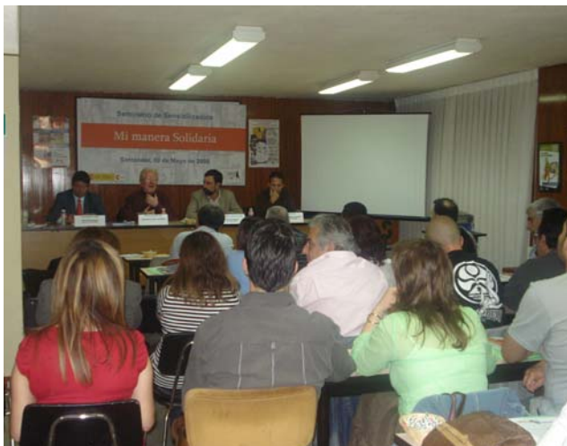
Seminario de Sensibilización en Cantabria

Educar y Sensibilizar en la Solidaridad es un compromiso por el SOTERMUN-USO seguirá trabajando.