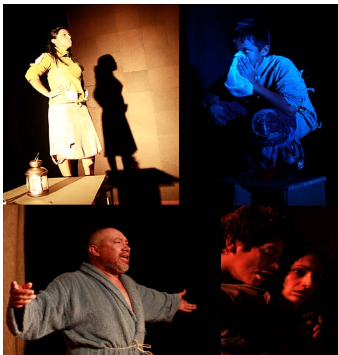
Algunos momentos de la Obra

Como culminación del proyecto de sensibilización financiado por la AECID (Agencia Española de Cooperación Internacional para el Desarrollo) y, para conmemorar el Día Internacional para la Erradicación de la Pobreza, el 17 de Octubre, SOTERMUN presentó la Obra teatral “El Pirañita” en el Colegio Mayor Argentino, representada por la Cía. de Teatro El Santuario del Cóndor, y con aforo completo.