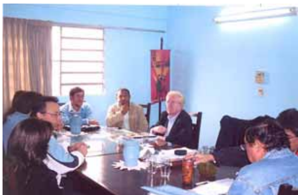
Con los dirigentes de la CNT y la UNE