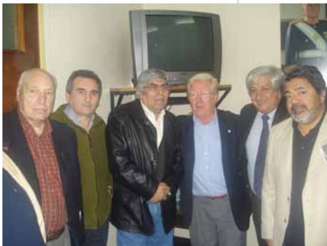
Con Hugo Moyano y otros dirigentes de la CGT

próximo. En su proyección se identifica un grado importante de incertidumbre, en muchos casos asociada a la fuerte desconfianza que les merece la clase política".