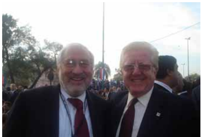
Con Joseph Stiglitz

Zaguirre reclamó la mayor solidaridad del sindicalismo internacional y de los gobiernos democráticos de América Latina, de España y del mundo, pues ésta será imprescindible para construir el cambio socio-económico y para reforzar las limitaciones parlamentarias de Lugo ante la vuelta a la carga de los viejos grupos oligárquicos que intentarán frenar el proceso y que nada cambie. Zaguirre lamentó públicamente que las delegaciones sindicales no fuesen más numerosas y que la única central de ámbito nacional europeo fuera la USO.