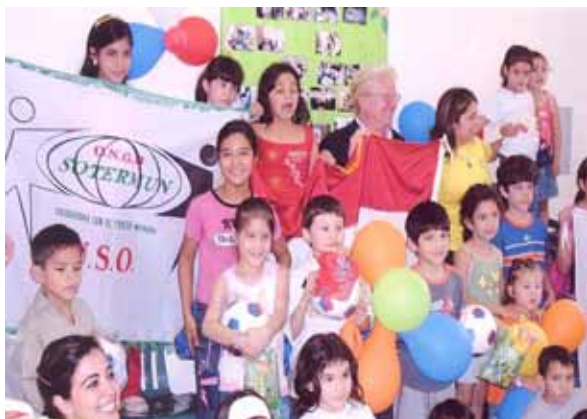
Fiesta del Día del Niño