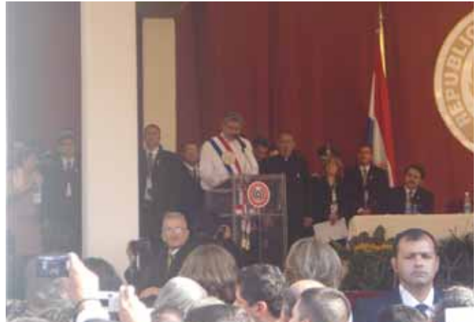
Primer discurso de Lugo como Presidente