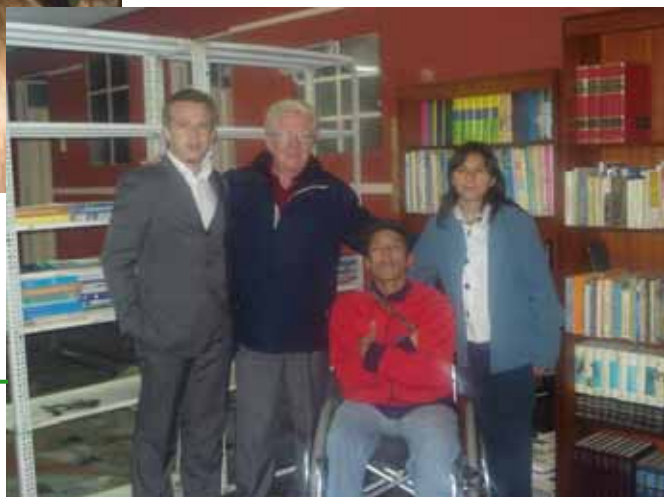
← Con los responsables del Centro Social de la CGT en Ciudad Bolívar