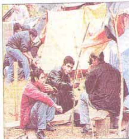
Pesimismo y desesperanza es el factor común en el grupo de jóvenes de hasta 20 años que afrontan la exclusión social

El valor más jerarquizado por los cuatro grupos sobre los que se hizo la encuesta (ver aparte) es la seguridad familiar. La demanda de protección, afecto y cuidado por parte de los familiares parece ser un denominador común tanto de los que poseen un grupo familiar estable como de los que pertenecen a grupos familiares desintegrados.