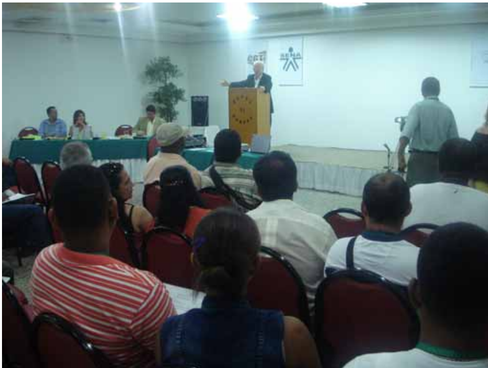
Foro Nacional de la CGT sobre diálogo social y trabajo digno

El Foro Nacional lo clausuró el líder de la CGT, compañero Julio Roberto Gómez, presentando un Programa para erradicar la precariedad laboral, afirmar la libertad sindical, seriamente amenazada y perseguida en Colombia, y abrir espacios a la economía productiva, el desarrollo de los sectores con más potencialidad, condiciones todas ellas para erradicar definitivamente la lacra del narco-terrorismo y la cultura de la muerte por otra de la paz, la democracia y la vida.