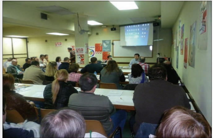
Asamblea de delegados en Burgos.

S OTERMUN ha continuado en la línea de actuación de los últimos meses, promoviendo diversas asambleas y reuniones con las Delegaciones Territoriales, con el objetivo de trasladar a los militantes, representantes sindicales y dirigentes de la USO y de SOTERMUN, nuestra trayectoria, nuestra realidad y nuestros proyectos en que estamos inmersos. Así, se han desarrollado en fechas cercanas, asambleas de representantes sindicales y cuadros en Burgos, Zaragoza y Valladolid, en las que se ha informado y debatido acerca de la aciaga situación actual de