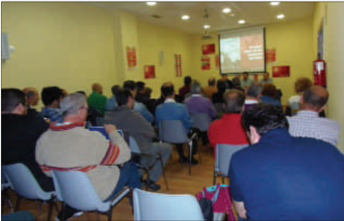
Delegados en la Asamblea de Valladolid.

la solidaridad internacional en la que los recortes de los recursos públicos siguen golpeando de lleno a la cooperación, las acciones e intervenciones solidarias desarrolladas por SOTERMUN desde su creación hace ahora 19 años, y los proyectos para superar esta etapa de crisis y encarar el futuro con estructuras más consolidadas, e instrumentos que aporten mayor calidad técnica, contable y de procedimiento a nuestra ONGD con los que prosperar en mejor y mayor gestión interna y externa de los proyectos.