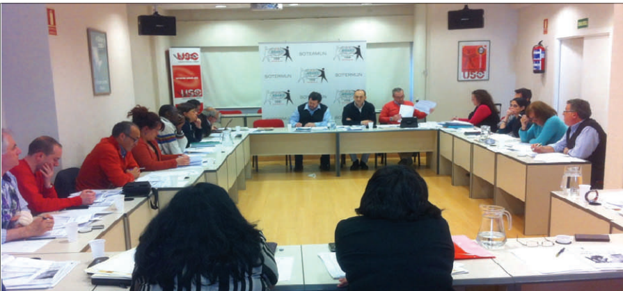
Asistentes a la Asamblea General de Sotermun.

S OTERMUN, la ONG de cooperación de USO, ha celebrado el día 12 de abril su Asamblea General Ordinaria y también una Extraordinaria. En ellas participaron socios y representantes de las diferentes Delegaciones territoriales. Previamente a este encuentro, el Presidente y los Vicepresidentes de SOTERMUN realizaron asambleas en Andalucía, Aragón, Asturias, Baleares, Castilla la Mancha, Cataluña, La Rioja, Madrid, Murcia, Navarra y País Vasco. Durante las sesiones se renovó con energía nuestro compromiso con la solidaridad internacional pese a la situación de recortes en la Ayuda Oficial al Desarrollo.