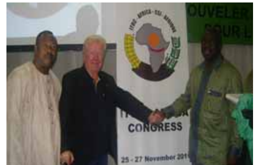
Con el Secretario General y el Adjunto electos