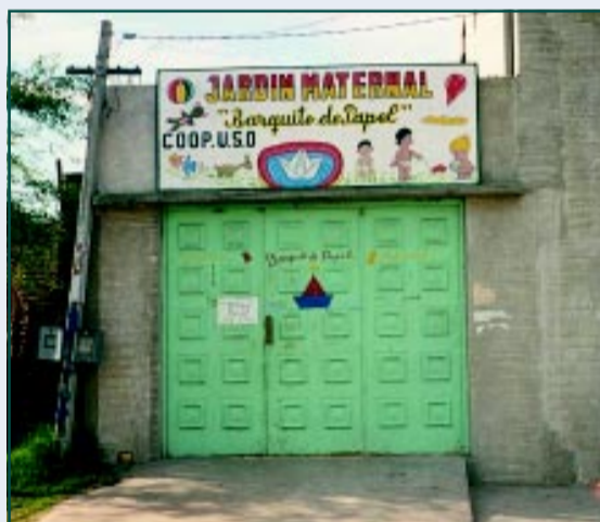
La cooperación de U.S.O. reflejada en el cartel de este jardín maternal "Pantalón cortito".

Financiado por el Ayuntamiento de Valladolid con 7.073 euros y por la Diputación Provincial de León con 32.992 euros, dirigido a infraestructura y equipamiento para campesinos.