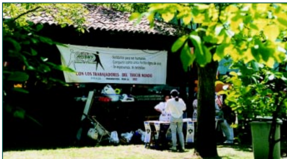
Paz Vázquez atiende el stand de Sotermun en la fiesta anual de Asturias

Respecto a otras ONGD's que funcionan en Asturias, destacaríamos que por parte de SOTERMUN, disponemos de menos militantes, por lo que las tareas recaen en 2 ó 3 personas, y aunque los afiliados responden con donaciones o compra de los diferentes artículos, no existe esa implicación necesaria para lograr mayores objetivos, seguramente la culpa es nuestra, por no saber llegar a ellos y comprometerlos mucho más con el desarrollo de jornadas solidarias que den a conocer el trabajo de SOTERMUN y en definitiva que la USO no se puede entender sin nuestra ONGD y viceversa. ♦