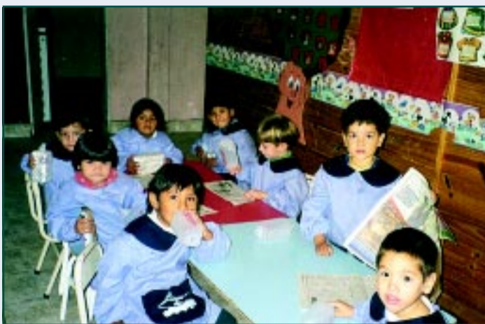
Comedor escolar de Barquito de Papel en Argentina