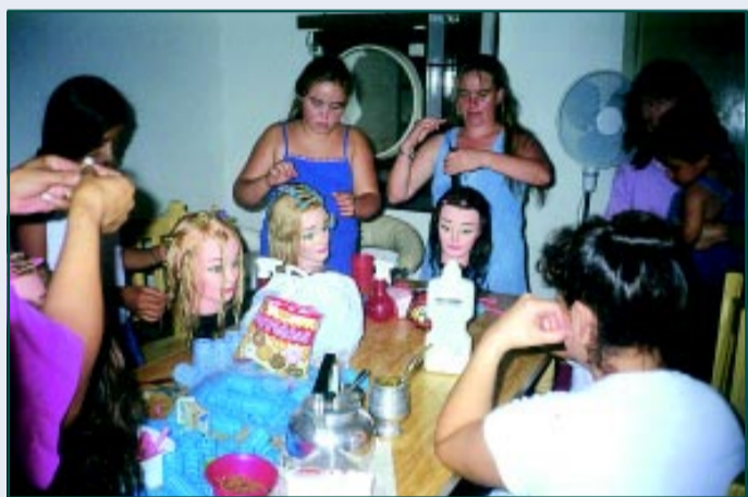
Taller de peluquería en el Hogar-Refugio par Mujeres e Hijos Maltratados "María Pueblo" en Argentina.