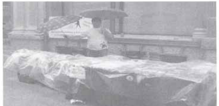
Lluçmajor, solidaridad bajo la lluvia

Además, no se lo pierdan, en la Feria de Lluçmajor-Mallorca nuestra Tienda Solidaria Ambulante vendió cocas, ensaimadas, dulces de fabricación casera que afiliadas y simpatizantes del Hospital Sont Llàtzer y Càrnics Semar nos donaron como contribución solidaria para comprar la ambulancia medicalizada de Haití. Desde SER SERES SOLIDARIOS damos las gracias a todos los que con su imaginación y colaboración producen solidaridad.