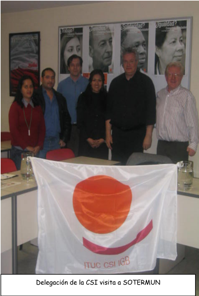
Delegación de la CSI visita a SOTERMUN