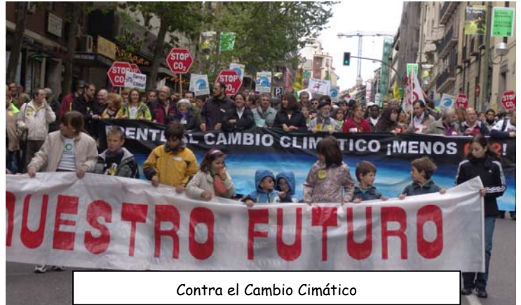
Contra el Cambio Climático