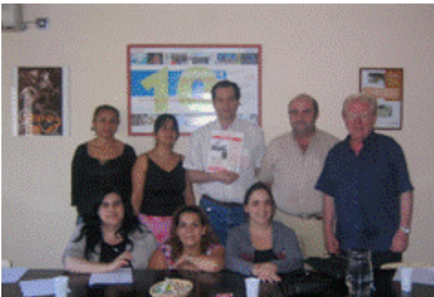
Con la delegación de USO-SOTERMUN de Madrid