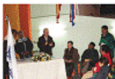
Una reunión de la Asociación Paraguaya por la USO en un momento importante de su creación, el 11 de octubre de 2005 en Asunción.

Paraguay es uno de los países más socialmente empobrecidos y aislados de Latinoamérica. Siempre durante medio siglo a una vivienda deteriorada y un medio de vida precario, a una política social ultra-oligárquica, a un agua desahogado en lo social a través de fugas migratorias dirigidas hacia España, y otros países más prósperos, de centenares de miles de paraguayos que hoy en día de falta de trabajo y oportunidades en su propio país.