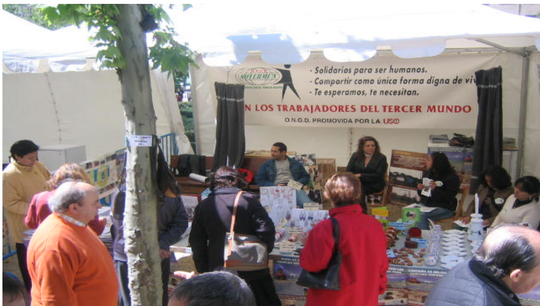
La Tienda Solidaria Ambulante (TSA) a pleno rendimiento