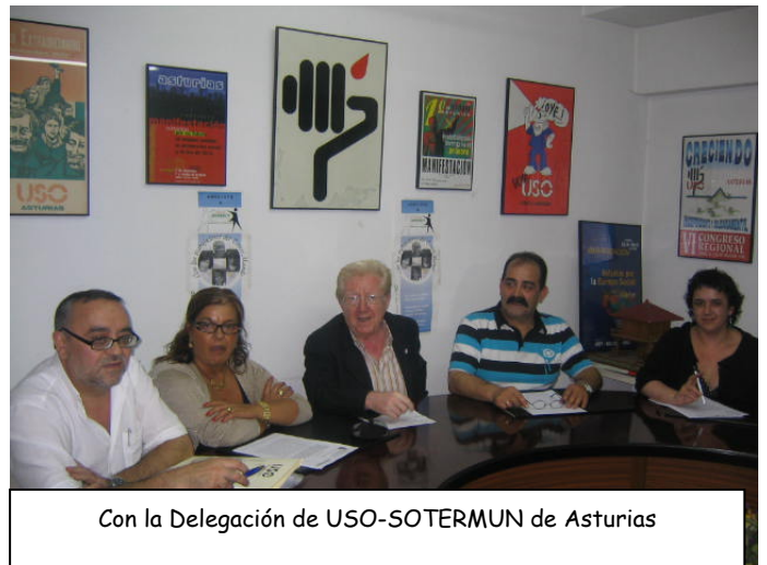
Con la Delegación de USO-SOTERMUN de Asturias