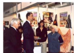
El Príncipe de Asturias y el Presidente de Castilla-La Mancha visitan una Tienda Solidaria de SOTERMUN en Toledo. Conversan con sus compañeros y se hacen un momento. Desde: Don Felipe y Don José María, y no perdón nunca la perspectiva solidaria en sus importantes responsabilidades institucionales y políticas.

Es una gran noticia. Se trata del primer Ayuntamiento del país que por primera vez concede un importante proyecto solidario a SOTERMUN. Por un importe de casi 130.000 euros, así destinados a la producción y comercialización de aguapanela (planta autóctona con fines alimenticios y medicinales) en el departamento de Cajamarca-Perú. Nuestro reconocimiento al Ayuntamiento de Madrid por la confianza depositada en SOTERMUN y en los miles de personas humildes que se benefician de este proyecto es el Perú.