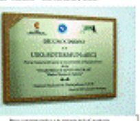
Presidencia de la Agencia Española de Cooperación Internacional (AECI).

Por eso, el 11 de octubre de 2005, se creó la Asociación Paraguaya por la USO, una entidad que tiene como objetivo principal promover y desarrollar proyectos de cooperación internacional en el campo del trabajo decente y la vida digna.