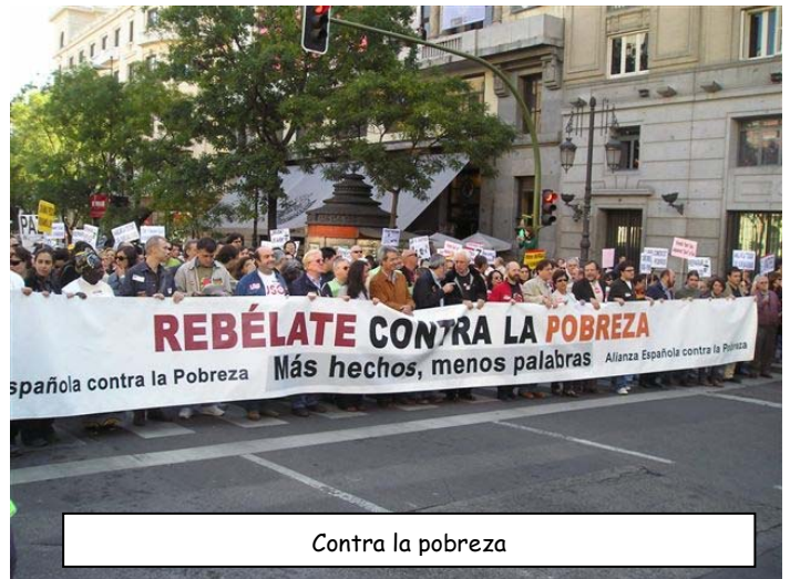
Contra la pobreza