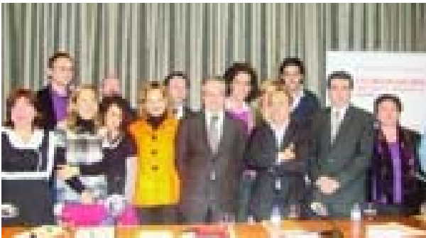
Líderes políticos firman pacto contra la pobreza