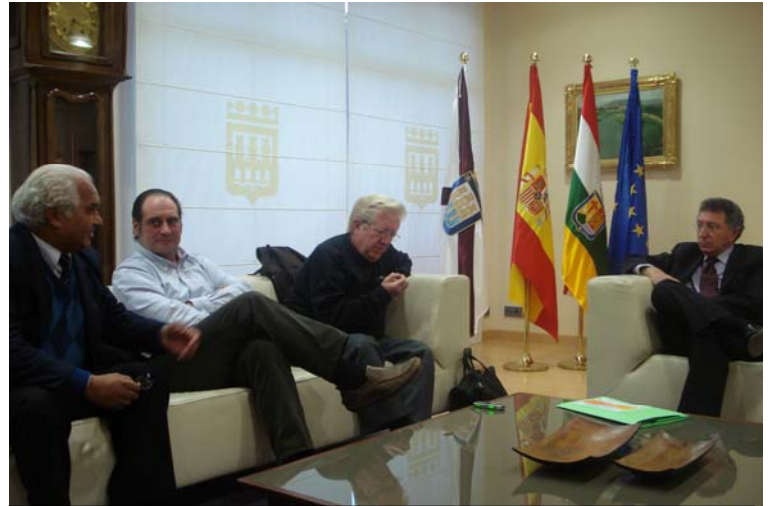
La CNT de Paraguay con el Alcalde de Logroño