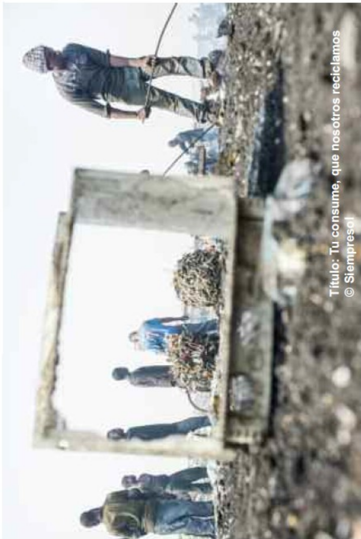
Título: Tu consume, que nosotros reciclamos © SiempreSol