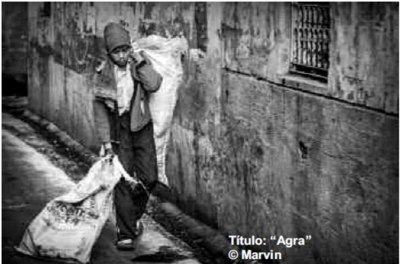
Título: "Agra" © Marvin

Accésits IV Concurso Fotográfico SOTERMUN '2015